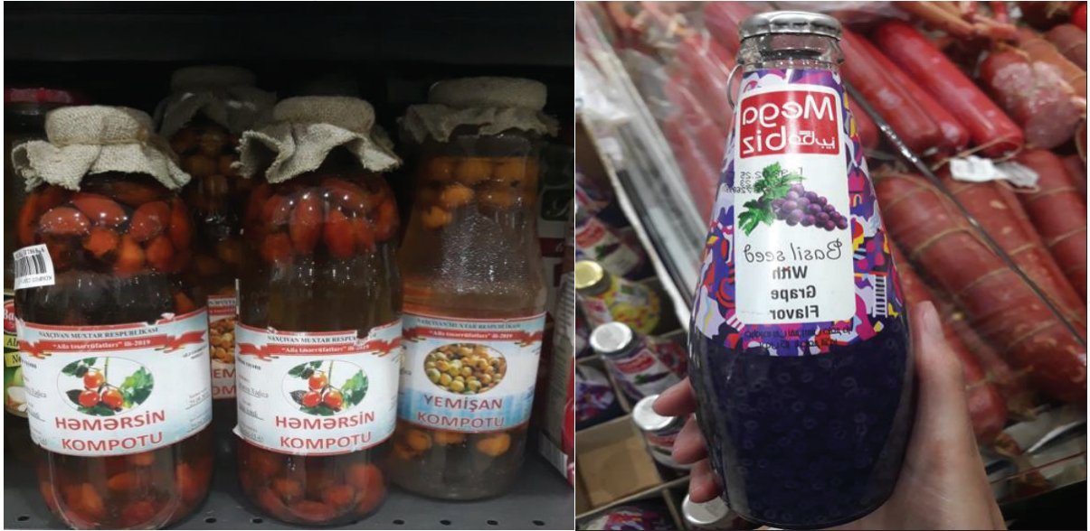
Fotoğraf 1: Küçük Çaplı İmalathanelerde Üretilen Gazsız İçecekler

Nahçıvan'ın ihracat yaptığı başlıca ülkeler Rusya, İran, Türkmenistan ve Gürcistan'dır. İthalat yaptığı ülkeler ise Türkiye, İran ve Rusya'dır 19 . Nahçıvan Özerk Cumhuriyeti'nin dış ticaret hacmindeki ihracat ürünleri incelendiğinde sanayi ürünleri, taşıt, gazlı ve gazsız içecekler; ithalat ürünlerinin ise sanayi ürünleri, ulaşım vasıtaları ve parçaları, gıda ürünleri, inşaat malzemeleri, ilaç ve sağlık ürünleri, mobilya ve beyaz eşyanın ağırlıklı olduğu görülmektedir.