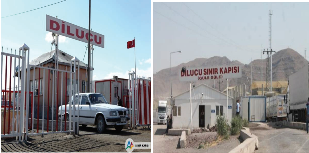
Fotoğraf 2- Dilucu Sınır Kapısının Modernize Edilmeden Önceki Hali