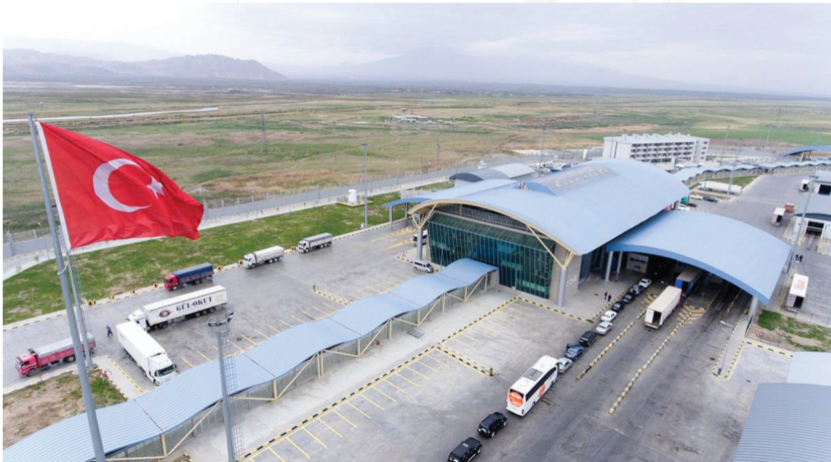
Fotoğraf 3- Dilucu Sınır Kapısının Modernize Edildikten Sonraki Hali