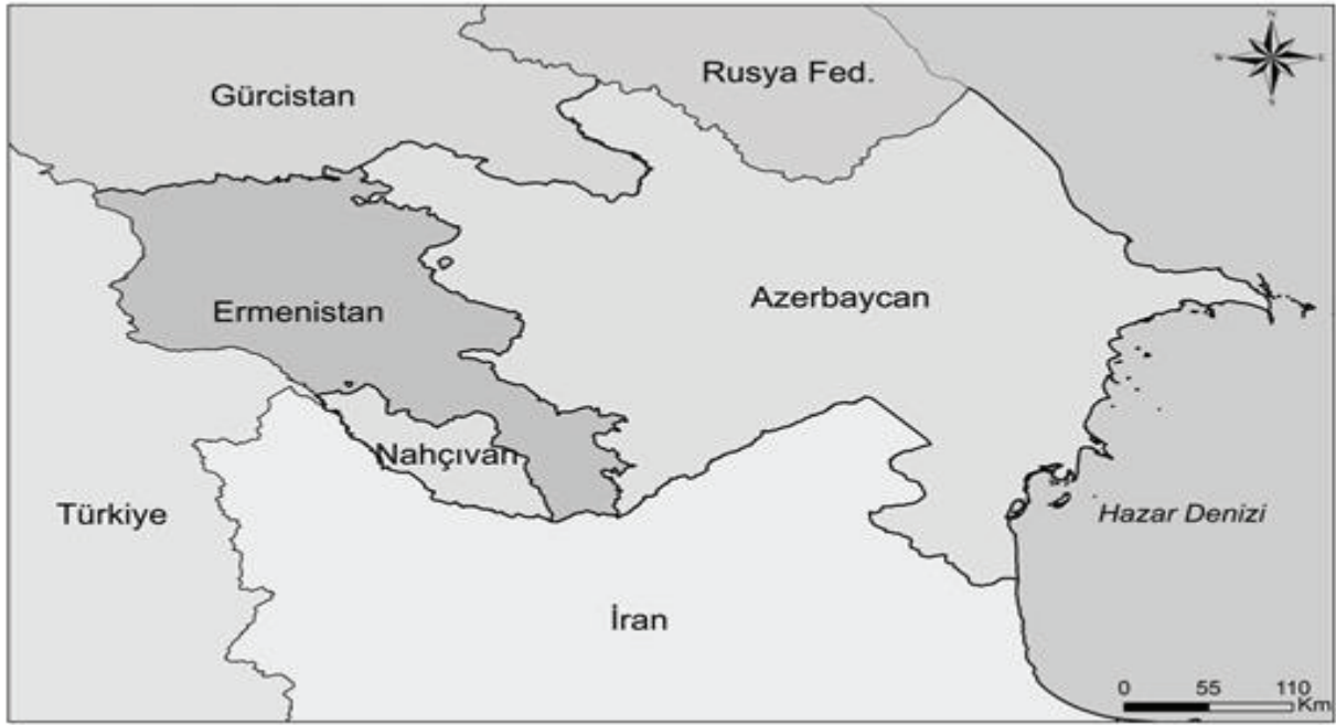
Harita 1- Nahçıvan Özerk Cumhuriyeti'nin Konumu

Kaynak: Siyasi Coğrafya Açısından Nahçıvan Özerk Cumhuriyeti, Serhat ZAMAN, Pegem Akademi, 2014.